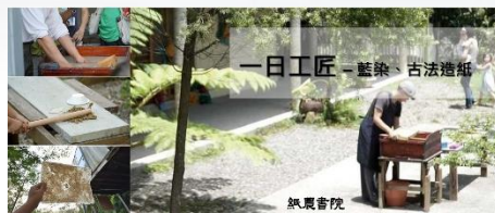
手工造紙 ▶ 紙農書院