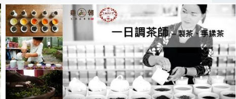
調茶 ▶ 雞朝/上福裕茶葉